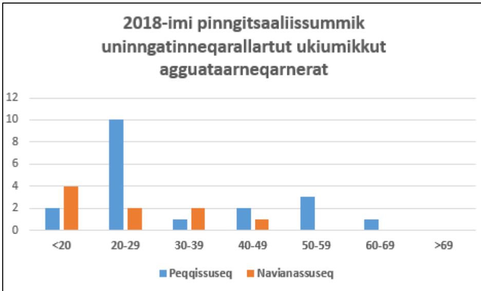
Takussutissiaq 3: 2018-imi pinngitsaaliissummik uningatinneqarallartut ukiuisa agguataarneqarnerat.

Napparsimasut pinngitsaaliissummik uningatinneqarallartut amerlanersaat 20-it 29-illu akornanni ukioqarput.