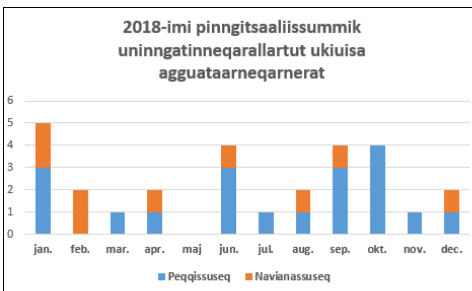
Takussutissiaq 4: 2018-imi pinngitsaaliissummik uningatinneqarallartut qaammatinut agguataarlugit.

Agguaqatigiissillugit ullut uningatinneqarallartut 31,9-upput, pinngitsaaliissummik uningatinneqarallannerisalu sivissususaat 3-iniit 211-inut (ullut 100 aamma ullut 111, katillugit) nikerarluni (tabeli 8 takuuk).